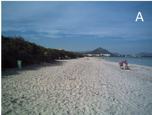
Fig. 2. Pictures of the study area. A. Es Braç beach in 2005. B. Es Comú beach in 2005. C. Dune front situation in Es Comú beach in 2014. The root exposition and dune collapse are clearly visible. D. Visible erosion over the incipient dune by the waves in Es Comú in 2014. E. Conduction marks over the incipient dunes excluded from the protection (Es Comú, 2014). F. Replant actions in the dune front in Es Comú.

Fig 2. Fotos de la zona de estudio. A. Playa de Es Braç en 2005. B. Playa de Es Comú en 2005. C. Situación del frente dunar en la playa de Es Comú en 2014. Se aprecian las raíces descubiertas y el derrumbamiento de dunas. D. Erosión visible de las dunas embrionarias en Es Comú por el oleaje en 2014. E. Marcas de conducción sobre las dunas embrionarias excluidas del vallado (Es Comú, 2014) F. Labores de replantación en el frente dunar de la playa de Es Comú.